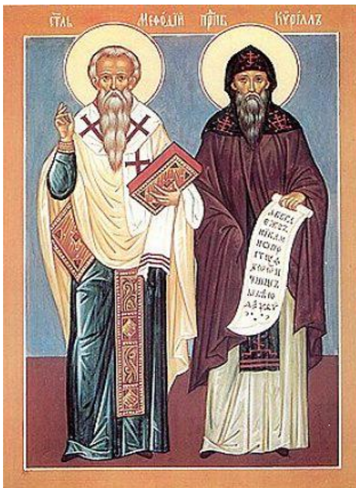
Кирилл и Мефодий. Репродукция иконы http://www.150solumc.edusite.ru/p174aa1.html