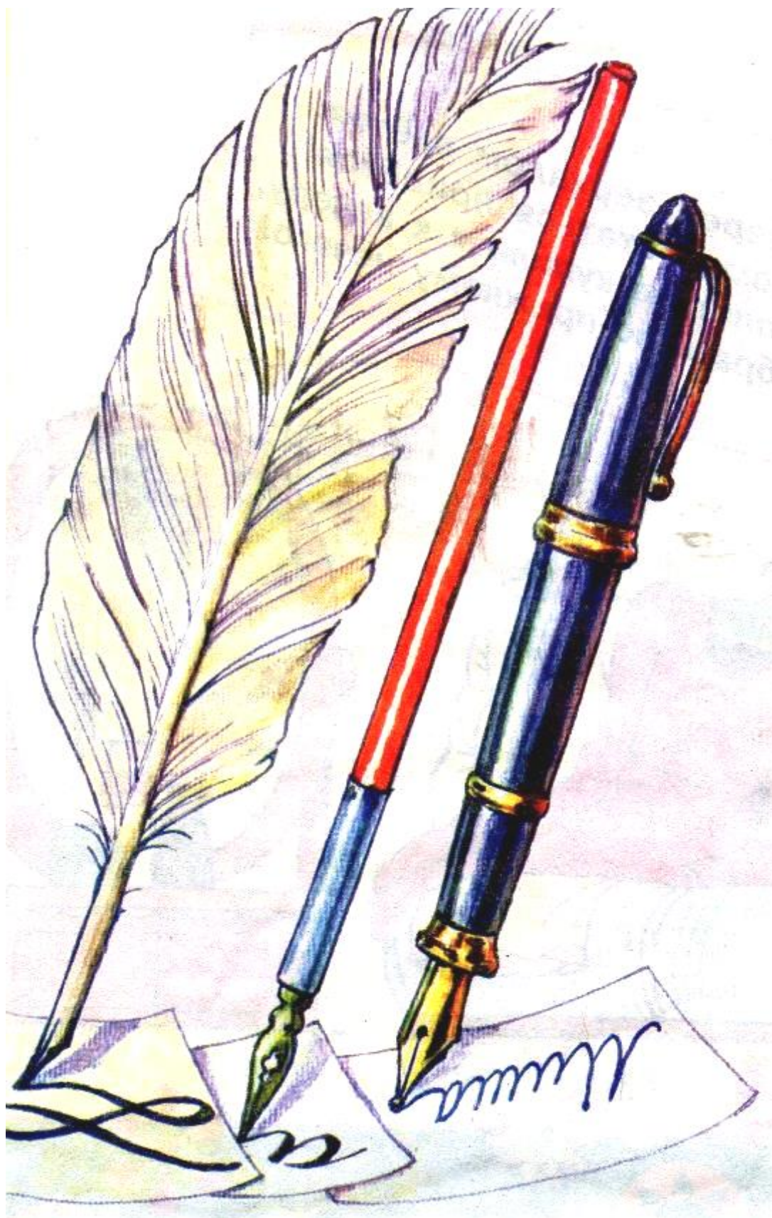
Письменные принадлежности: гусяное перо, стальное перо, авторучка