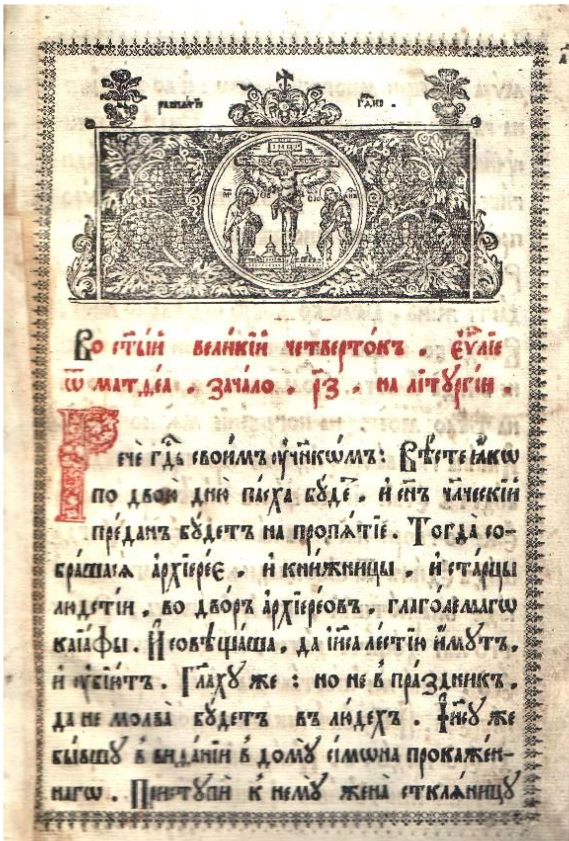
Евангелие. Московская типография. 1745 г. МКУК «Ирбитский историко-этнографический музей». Инв. № 1126. Д. 1303.