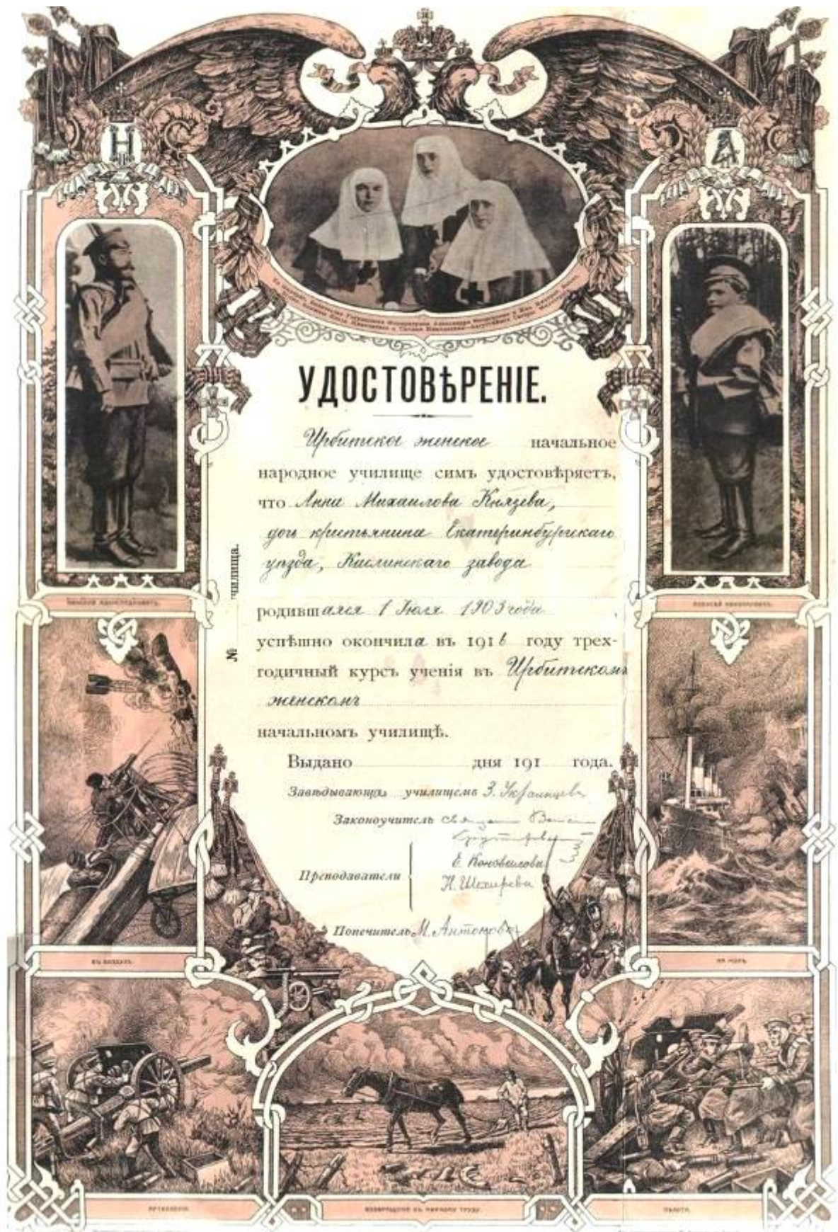
Удостоверение А.М. Князевой об окончании Ирбитского женского начального народного училища. 1916 г. ГКУСО «ГА в г. Ирбите». Ф. Р-462. Оп. 1. Д. 3. Л. 79.