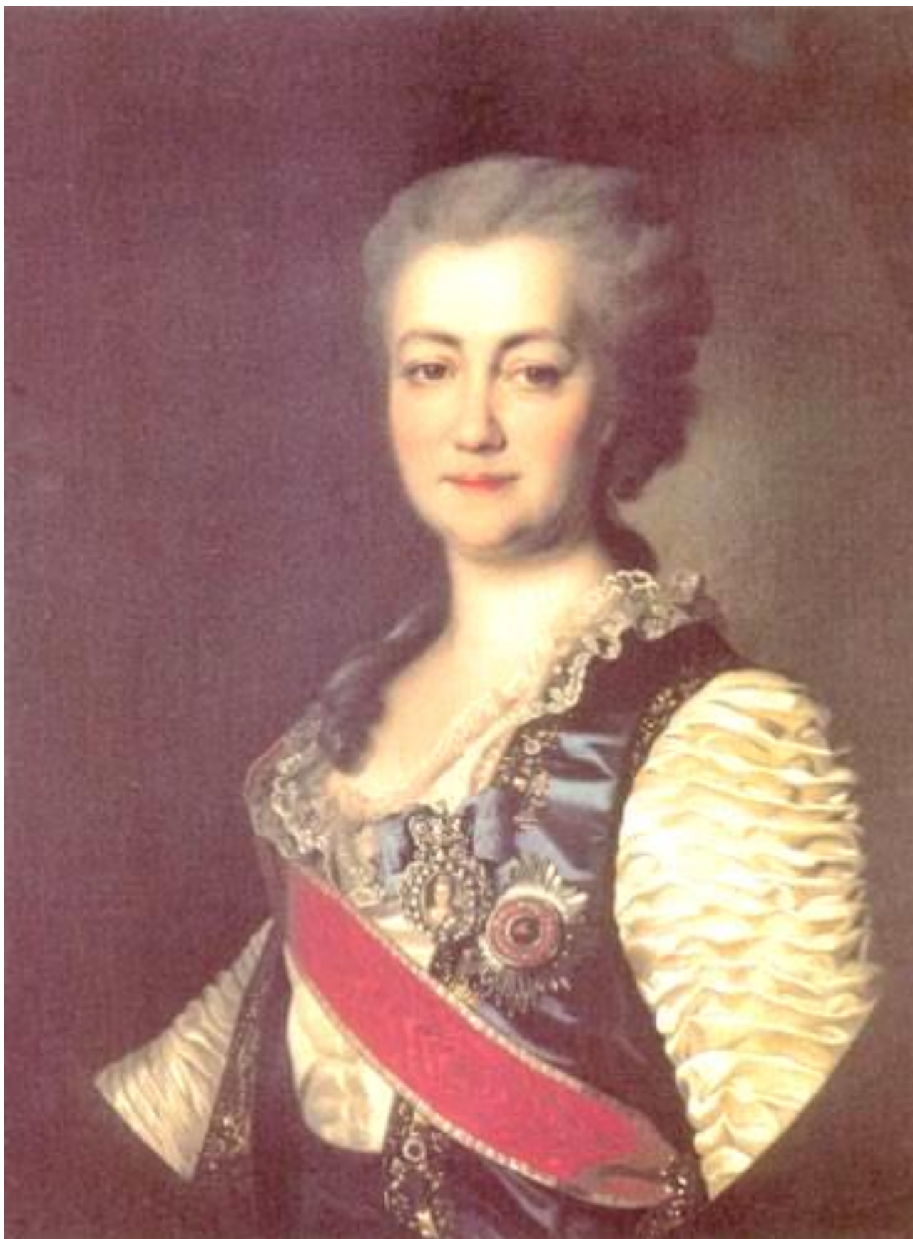
Портрет Е.Р. Дашковой. Репродукция картины Д.Г. Левицкого http://biography.sgu.ru/art.php?art=37338