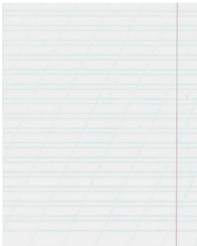
Образец разлиновки тетради в косую линейку. 2000-е гг.