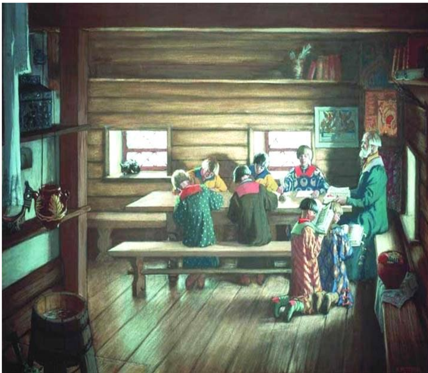
Земская школа в Московской Руси. Репродукция картины Б.М. Кустодиева. 1907 год. Государственный Русский музей. Санкт-Петербург.