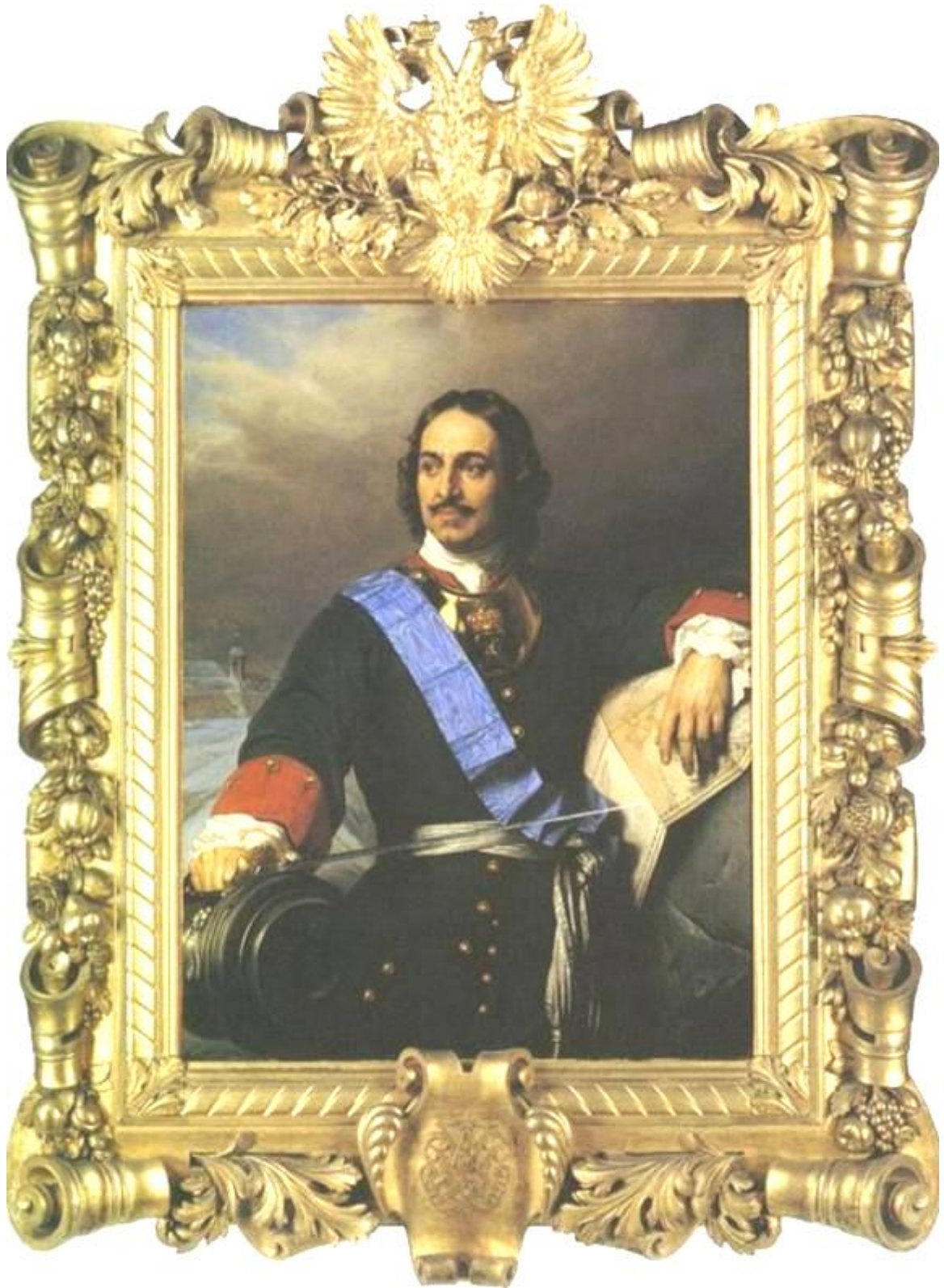
Портрет Петра I. Репродукция картины П. Делароша http://img.lenta.ru/photo/2009/06/30/medals/19.jpg