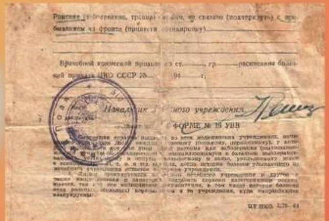
Справка о ранении. 1945 год. ГКУСО «ГА в г. Ирбите». Ф. Р-998. Оп. 6. Д. 2. Л. 2.

За годы войны четырежды ранен, получил инвалидность. До 1955 года продолжал службу в вооруженных силах.