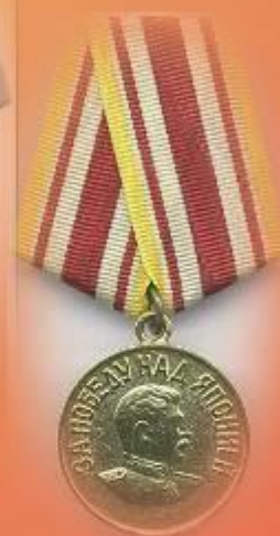
Медаль «За победу над Японией»