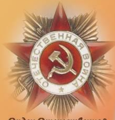
Орден Отечественной войны II степени