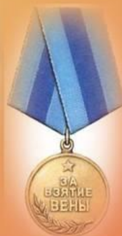
Медаль «За взятие Вены»