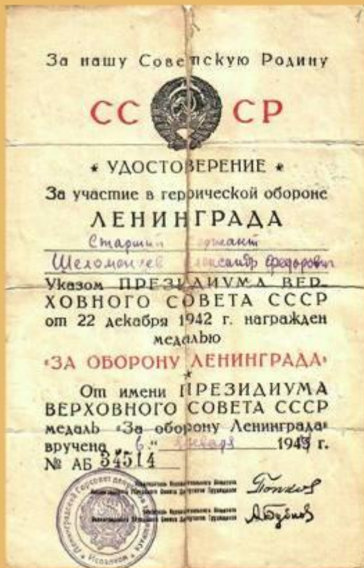
Удостоверение к медали «За оборону Ленинграда». 6 января 1944 года.

ГКУСО «ГА в г. Ирбите» Ф. Р-998. Оп. 1. Д. 9.