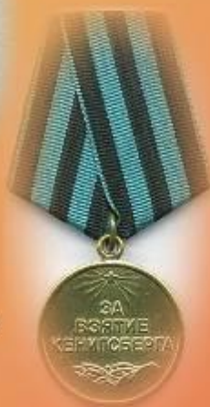
Медаль «За взятие Кенигсберга»