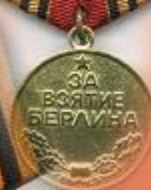
Медаль «За взятие Берлина»