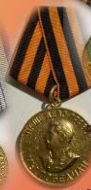
Медаль «За победу над Германией»