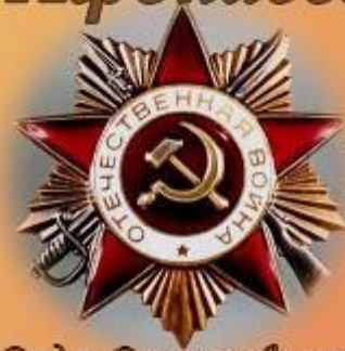
Орден Отечественной войны I степени

ГКУСО «ГА в г. Ирбите». Ф.Р-998. Оп. 12. Д. 2. Л. 3.