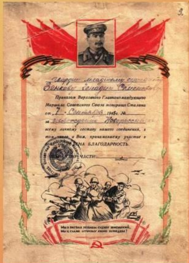
Благодарность гвардии младшему сержанту за освобождение Новороссийска 07 сентября 1945 года ГКУСО «ГА в г. Ирбите». Ф. Р-998, Оп.15, Д. 2, Л.3.

Имеет 8 благодарностей от Верховного главнокомандующего Генералиссимуса товарища Сталина, в том числе за освобождение городов Тамани, Новороссийска, Феодосии, Севастополя.