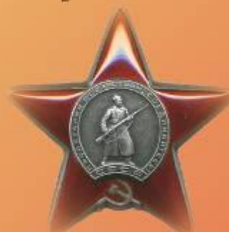
Орден Красной звезды