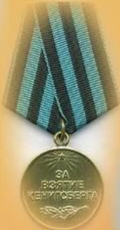
Медаль «За взятие Кенигсберга»