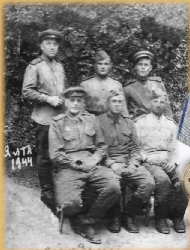
С сослуживцами. 1944 год.