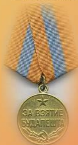
Медаль «За взятие Будапешта»

ГКУСО «ГА в г. Ирбите». Ф. Р-998. Оп. 3. Д. 1. Л. 46.