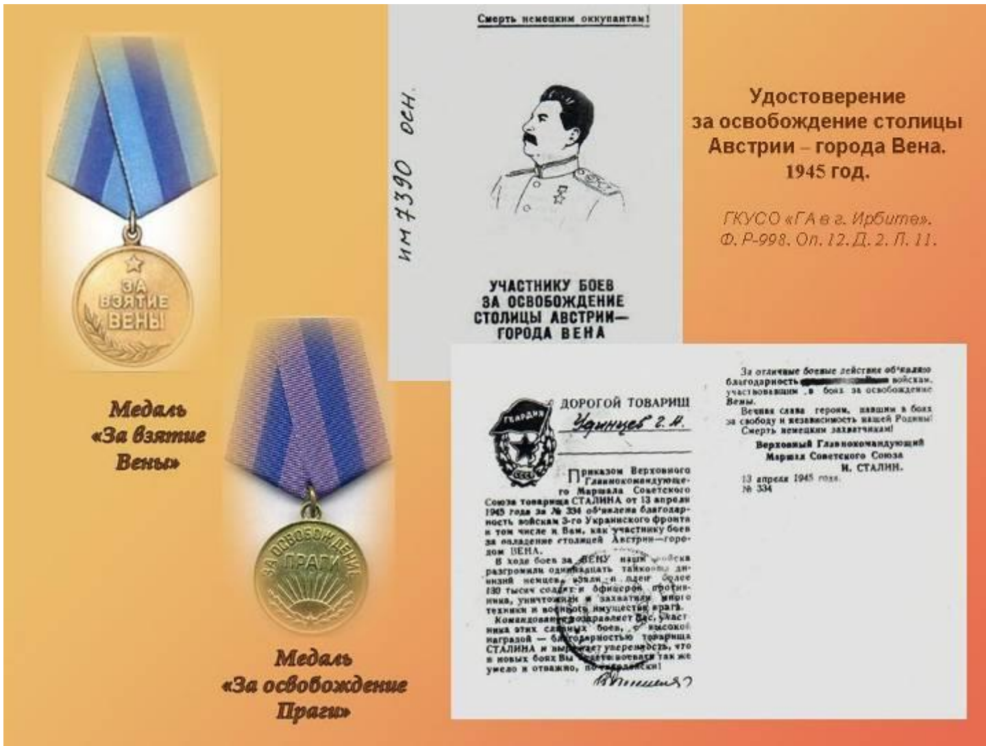
Медаль «За взятие Вены»