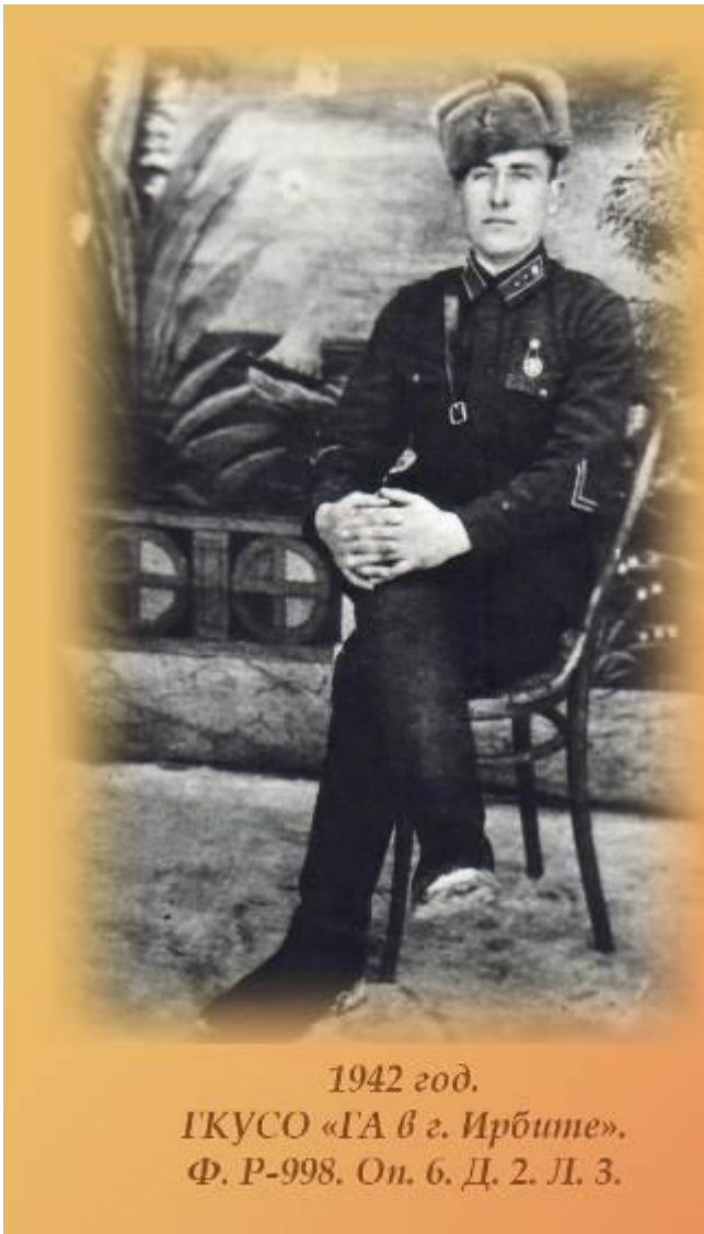
1942 год. ГКУСО «ГА в г. Ирбите». Ф. Р-998. Оп. 6. Д. 2. Л. 3.