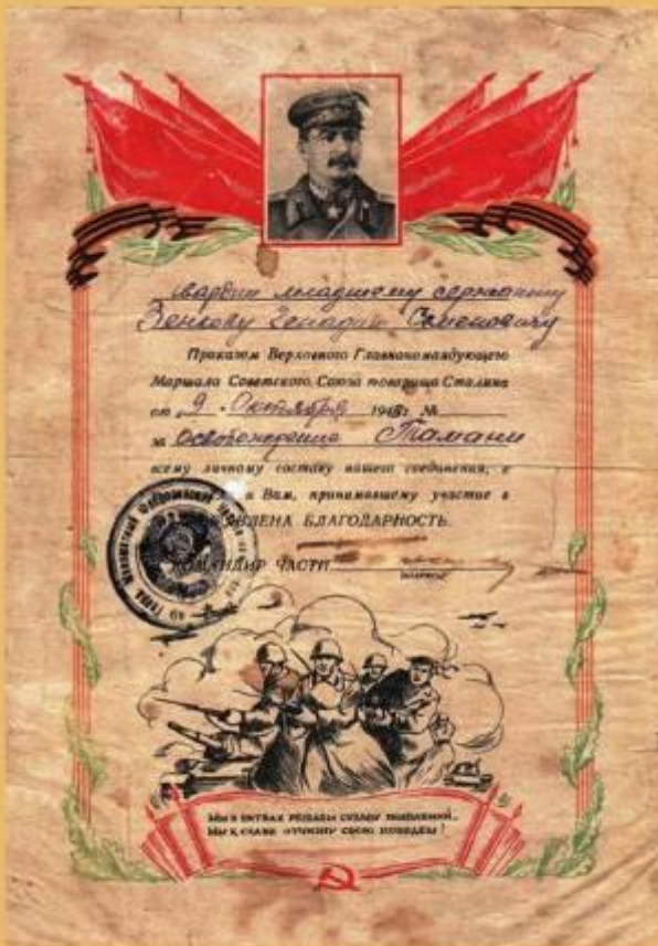
Благодарность гвардии младшему сержанту за освобождение Тамани 9 октября 1943 года.