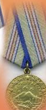
Медаль «За оборону Кавказа»