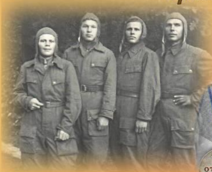
С однополчанами 105-й воздушно-десантной дивизии (второй слева). 1949 год.

ГКУСО «ГА в г. Ирбите». Ф.Р-998. Оп. 12. Д. 2. Л. 3.