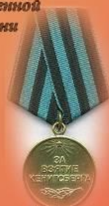
Медаль «За взятие Кенигсберга»