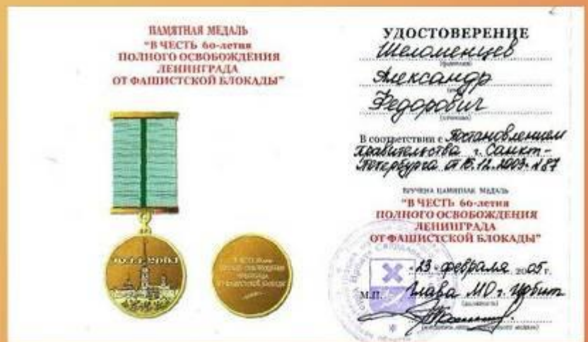
Удостоверение к медали «В честь 60-летия полного освобождения Ленинграда от фашистской блокады». 16 декабря 2003 года.

ГКУСО «ГА в г. Ирбите» Ф. Р-998. Оп. 1. Д. 9.