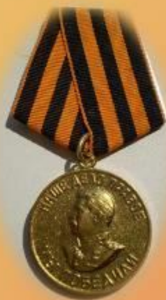
Медаль «За победу над Германией»

1946 год. ГКУСО «ГА в г. Ирбите». Ф. Р-998. Оп. 1. Д. 2. Л. 30.