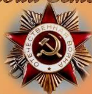
Орден Отечественной войны I степени