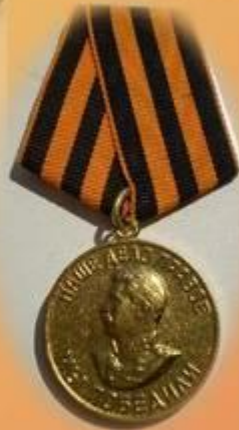
Медаль «За победу над Германией»