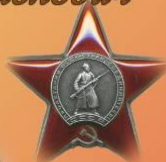
Орден Красной звезды