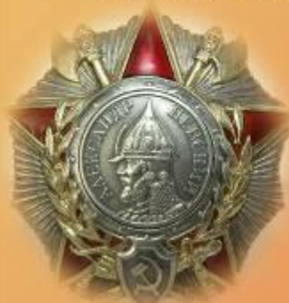
Орден Александра Невского

1970-е годы. ГКУСО «ГА в г. Ирбите». Ф. Р-998. Оп. 10. Д. 2.