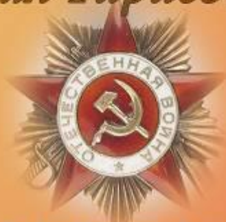
Орден Отечественной войны II степени