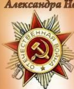
Ордена Отечественной войны II степени